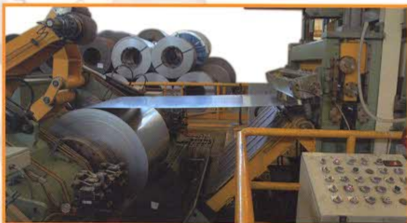
Spianatrice: Tavola 1600mm Spessore: da 0,8mm a 6mm