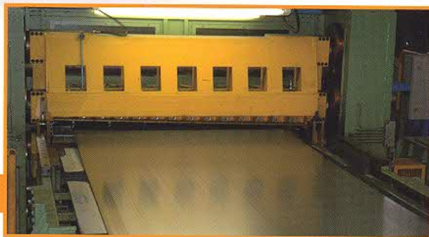
Spianatrice: Tavola 1600mm Spessore: da 0,8mm a 6mm