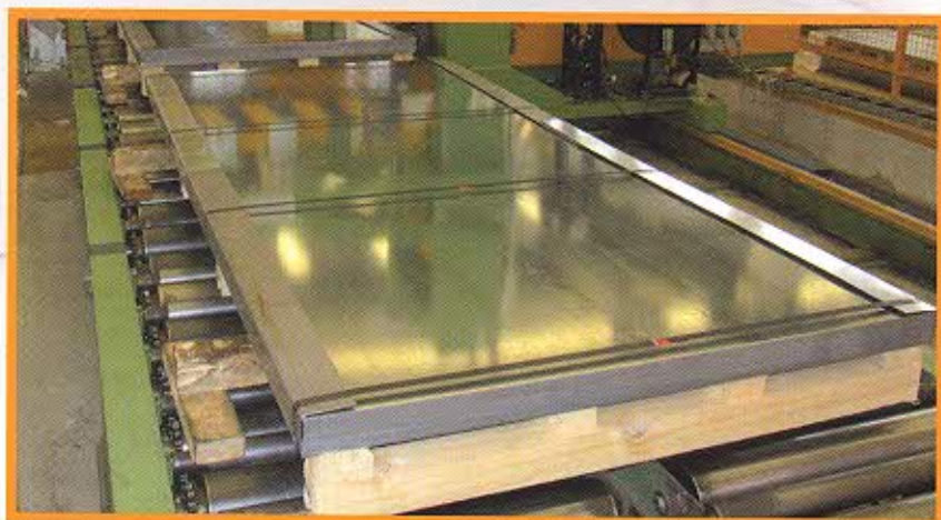
Spianatrice: Tavola 1600mm Spessore: da 0,8mm a 6mm

SCM dispone inoltre di un vasto magazzino di lamiera in formato commerciale in spessori da 0,5mm. a 15mm. nelle qualità decapate, laminate a freddo e rivestite (zincate a caldo, elettrozincate, ed aluzinc.) che permettono all'Azienda di effettuare consegne dal pronto in tempi molto ristretti, anche in giornata. Un adeguato laboratorio dove personale esperto procede all'analisi delle caratteristiche meccaniche dei prodotti tese alla verifica della rispondenza degli stessi alle specifiche delle varie Euro Norme di riferimento è disponibile ad offrire un servizio gratuito di consulenza tecnica pre e post vendita.