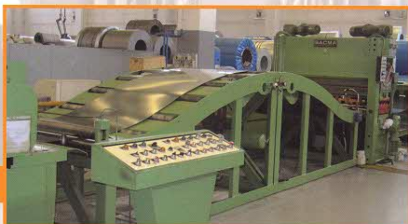
Spianatrice: Tavola 1500mm Spessore: da 0,5mm a 4,0mm